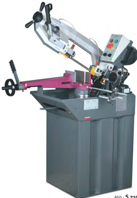
Abb.: S 210 G