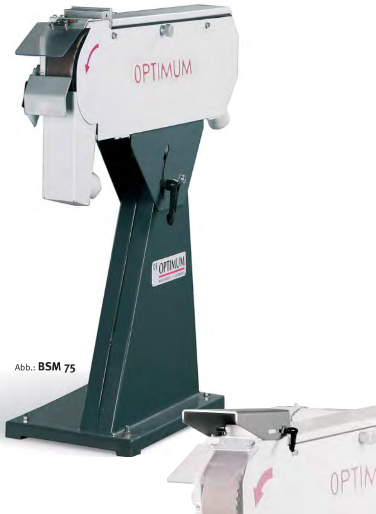
Abb.: BSM 75