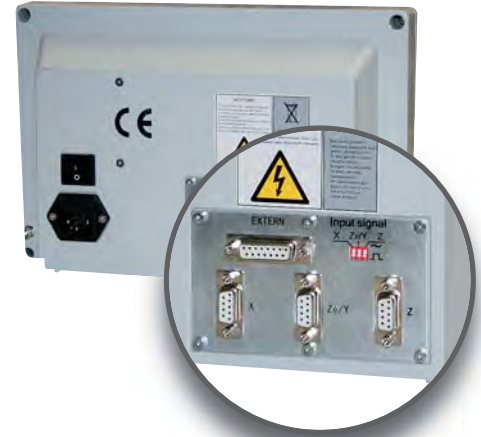
Abb.: Rückansicht DPA 2000 S