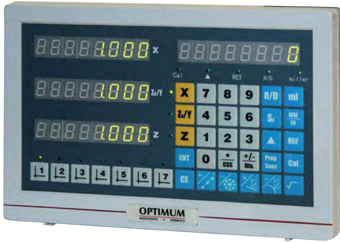
Abb.: DPA 2000 S