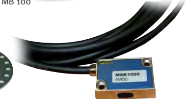
Abb.: Lesekopf Aktiv