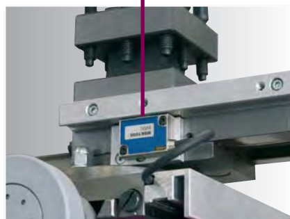
· Magnetband mit aktiven Sensor