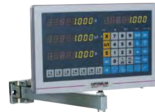
i Info DPA 2000 auf Seite 95